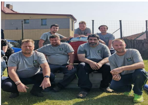
Memoriál Jana Procházky Podolí I