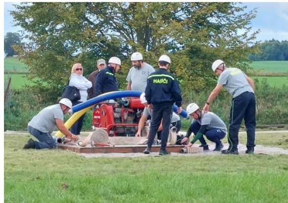
Memoriál Jaroslava Průži v Křenovicích