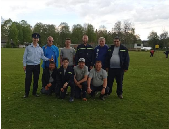
Soutěžní družstvo na okrskové soutěži v Branicích